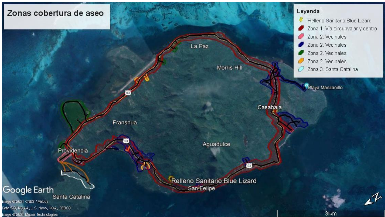
Ilustración 1. Zonas de cobertura del servicio de aseo.

El servicio se presta con frecuencia de seis (6) veces por semana para la zona de la vía principal (circunvalar) y la zona centro, para un total de 312 veces al año debido a la alta generación de residuos y a la importancia del sector; para el sector de vecinales se presta en frecuencias tres (3) veces por semana, es decir, entre 156 veces al año y la zona de Santa Catalina con en frecuencias tres (3) veces por semana, es decir, entre 156 veces al año.