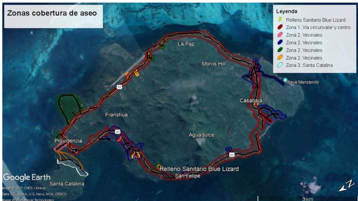
Ilustración 1. Zonas de cobertura del servicio de aseo.

Para el desarrollo de esta actividad, P&K ha dividido a el municipio en 3 zonas geográficas (vía circunvalar y centro, la zona de vecinales y la zona de Santa Catalina).